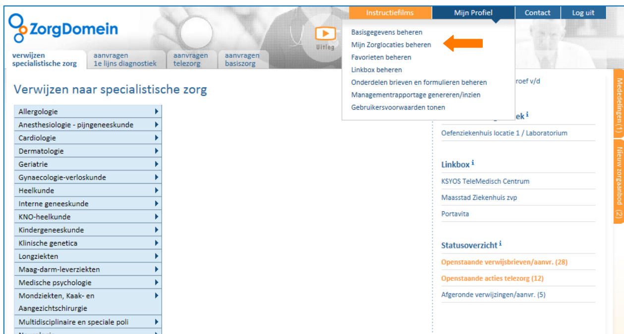
Figuur 1: het uitklapmenu "Mijn Profiel"